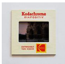
50 x 50 mm Dia

Sie haben Dias, egal ob lose oder im Magazin, und möchten dies digitalisieren. Wir können Kleinbilddias mit einem Rahmenaußenmaß von 50 x 50 mm verarbeiten. Diarahmenstärke bis 5mm. Gleich ob Kunststoffrahmen oder Glasdiarahmen.